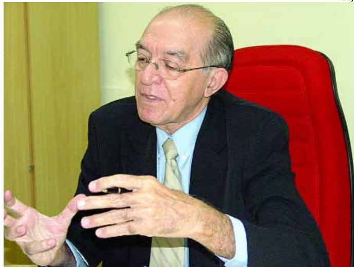
"Alagoas recebe R$ 214 milhões, ao invés de R$ 280 milhões"

A média padrão que o País paga por ano com cada brasileiro é apenas R$ 82,30, incluindo nesse valor até os procedimentos de alta complexidade. Os Estados ricos pressionam cada vez mais para fi-