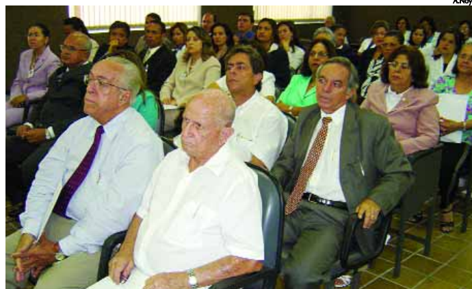
Platéia: diretores, irmãos e colaboradores conferem contas de 2004