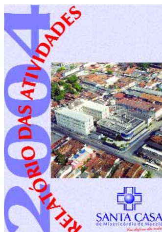
Além da exposição, foi distribuído o registro escrito das contas