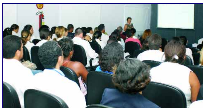
Concentração: todos acompanham atentos os temas expostos

diagnósticos e na descoberta de medicamentos bem mais eficazes. Por tudo isso, hoje, vive-se mais tempo”, alegou, frisando que é imperativo desenvolver hábitos que favoreçam uma velhice saudável.