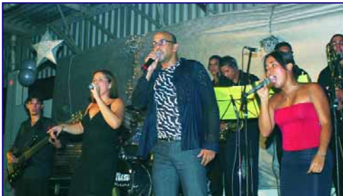
Música ao vivo animou a festa até o amanhecer