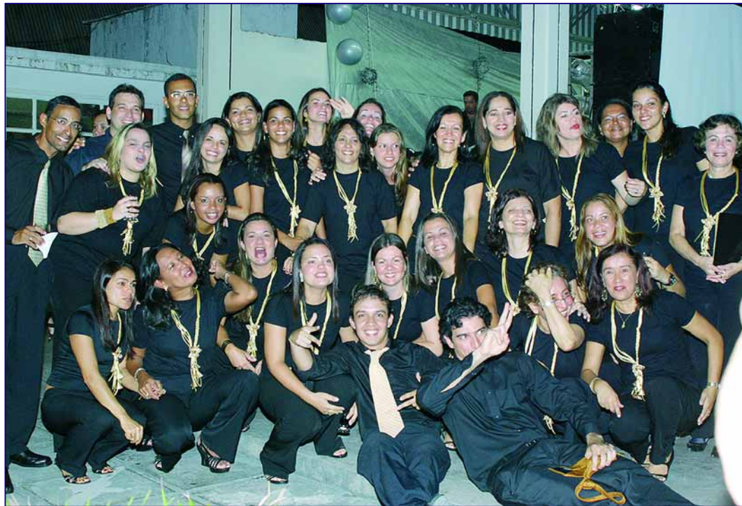
Os coralistas da Santa Casa fizeram uma linda apresentação, recebendo aplausos de todos