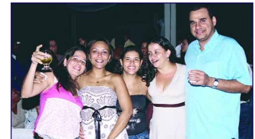
Fora do trabalho cada um mostra sua performance social