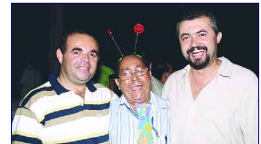
Irreverência e senso de humor entre os colegas