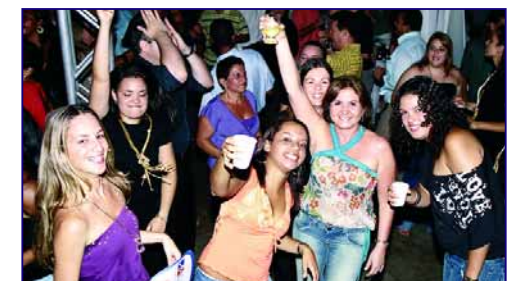
Muitos brindes aos desafios vencidos e aos novos