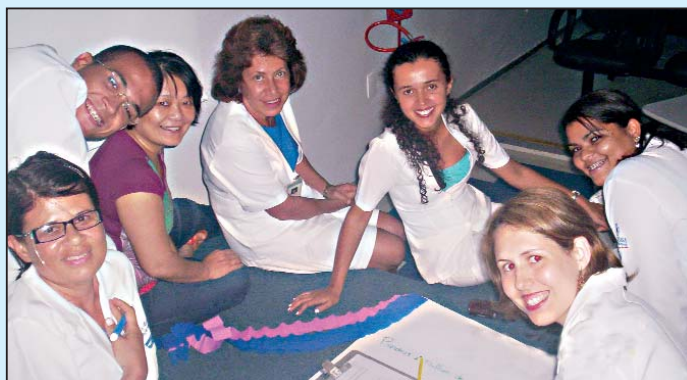
Uma das cinco equipes líderes de Enfermagem durante o processo de criação da nova proposta de trabalho

O primeiro passo do trabalho foi ouvir as enfermeiras líderes de cada setor. Elas expuseram as ocorrências mais comuns, definindo, assim, o diagnóstico efetivo. Os enfermeiros estão sempre sensíveis e atentos às necessidades de mudança, estabelecendo novas condutas para evitar o re-trabalho. Os processos devem ser realizados de maneira correta logo na primeira vez, sendo evitados acidentes e proporcionando ganhos para todo, tanto o paciente quanto o profissional de saúde e o hos-