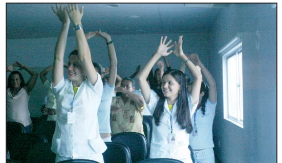
Atitudes simples e que podem ser incorporadas ao dia-a-dia favorecem a saúde