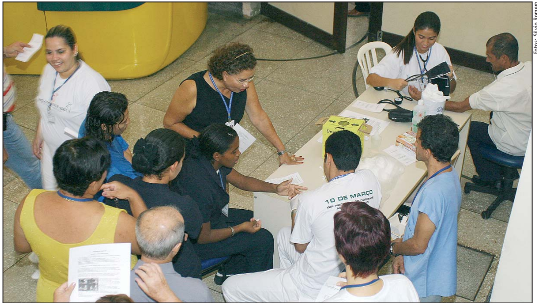
Colaboradores e visitantes foram envolvidos nas atividades do Dia de Combate ao Sedentarismo, que também incluiu aferição da pressão arterial e teste de glicemia