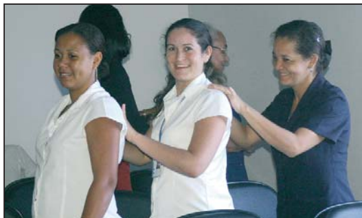
Levantar-se, esticar o corpo e massagear rapidamente a coluna aliviam as tensões