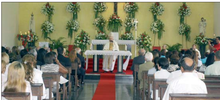
Toda começou com o ato de oração, agradecimento, confirmação da fé cristã e juramento público do bom propósito em zelar pelo engrandecimento do hospital, pelo bem-estar do paciente e pela espírito humanitário dos colaboradores