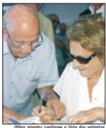
Outros irmãos conferem a lista dos votantes