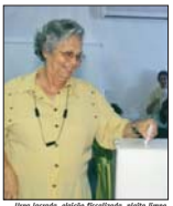
Uma lanchada, eleição finalizada, vitória para