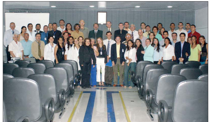
Alunos e mestres posam para foto tipo álbum de recordação cheios de novos conhecimentos para pôr em prática