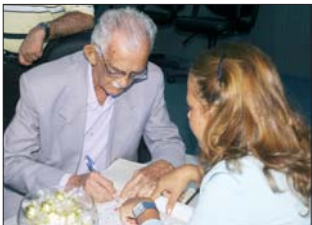
Um em um, os irmãos compareceram à urna e se dirigiram até à urna: foi uma eleição tranquila