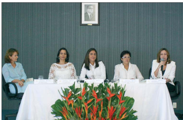
Elas deram o tom de credibilidade, força e valorização da participação feminina nas instituições