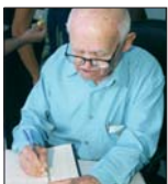
O discurso de encerramento e foi lido a sota